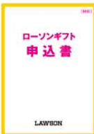
ギフト申込書表紙