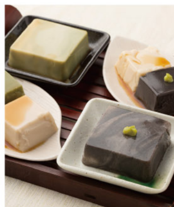
商品番号 246845 京五山 一口ごまとうふセット

京都北の天満宮のすぐ傍に店を構える、創業50年を超える老舗の胡麻豆腐専門店「京五山」が、有名料亭や寺院でも愛用されているこだわりのごまとうふと、京の町屋の豆腐店仕様の湯葉どうふをセットにしました。