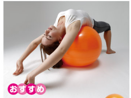
商品番号 246757 エクササイズボール55cm

ボールに乗るだけで、自宅で手軽に簡単エクササイズ！シェイプアップ運動やバランス運動、ストレッチなどにご活用いただけます。