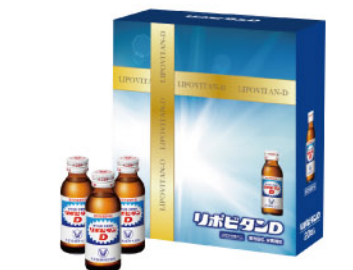
商品番号 056270 指定医薬部外品 大正製薬 リボタンD 20本セット