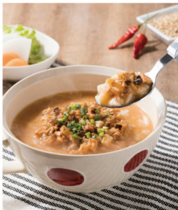
商品番号 246846 大地の〇(えん) ごはんにかけるスープ6食セット

具材は全て国産原料でアミノ酸(化学調味料)フリー。こだわりの鶏だしで作ったマトスープと担タスープです。調理いらずの簡便性とアレンジレシピの豊富さで、働く女性にうれしい商品です。