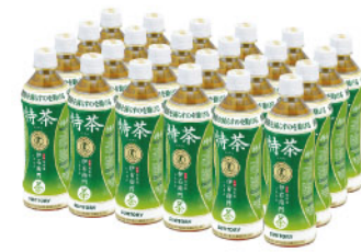
商品番号 056250 サントリー 伊右衛門特茶500ml 24本セット