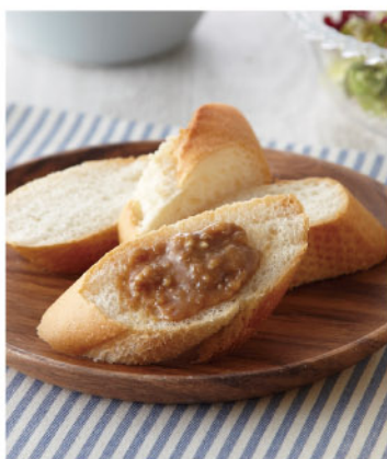
商品番号 246844 はちみつ入りごまと胡桃のペースト