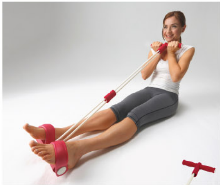
商品番号 246756 エクササイズブル

両手でハンドルを握り、足を掛けてハンドルを引っ張るだけの簡単な運動です。背中、腕などカンタンに鍛えられます！