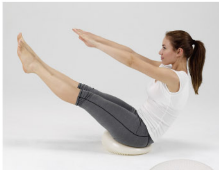
商品番号 246759 エクササイズクッション

普段お使いのクッション代わりに椅子に置くだけで、エクササイズボールの様なバランス運動や姿勢を維持する筋肉を使うことができます。