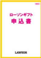
ギフト申込書表紙