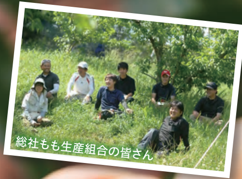
総社もも生産組合の皆さん