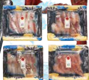
※お届けするのは上記4種のうち、おまかせ3種各1パック(計3パック)になります。